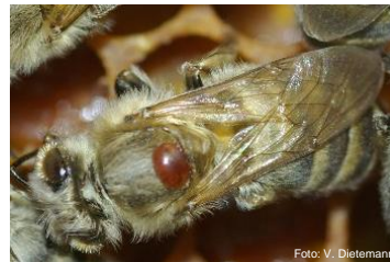
Varroa sur abeille

Phase 2 Le couvain ressemble à un «couvain en mosaïque», opercules de cellules ouverts, peu de couvain. Chrysalides, asticots ou abeilles mort/es dans les rayons ou sur la planchette de vol. En cas d'incertitude, faire appel à l'inspecteur des ruchers. Les abeilles ne peuvent plus être sauvées – souffrir.