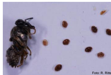
Abeille trouvée dans une cellule avec ses acariens