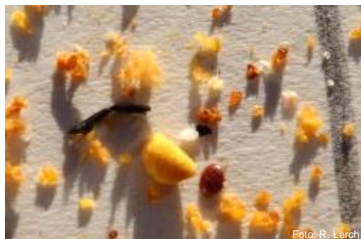
Acariens morts sur support

Phase 1 Varroas visibles seulement ici et là sur des abeilles. Chutes de varroas morts : plus de 10 acariens par jour. Dernier moment pour sauver la colonie à l'aide du traitement d'urgence. ( aide-mémoire 1.7.1 /1.7.2 ).