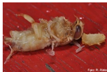
Chrysalide morte sur la planchette de vol

Phase 3 Instinct de nettoyage insuffisant, la colonie s'effondre. Enorme quantité de varroas dans les cellules restantes operculées. Déjections et peu d'abeilles sur les rayons. Chrysalides mortes. En cas d'incertitude du constat, faire appel à l'inspecteur des ruchers. Les abeilles ne peuvent plus être sauvées – souffrir.