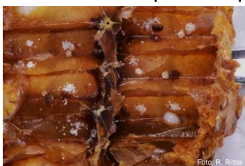
Cellules fortement infestées de varroas

Phase 3 Instinct de nettoyage insuffisant, la colonie s'effondre. Enorme quantité de varroas dans les cellules restantes operculées. Déjections et peu d'abeilles sur les rayons. Chrysalides mortes. En cas d'incertitude du constat, faire appel à l'inspecteur des ruchers. Les abeilles ne peuvent plus être sauvées – souffrir.