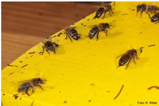
Planche de vol avec traces brun clair et brun foncé d'excréments

L'apiculteur peut identifier le Nosema apis et la dysenterie aux traces d'excréments visibles sur la planche d'envol et les cadres (surtout au printemps). D'autres symptômes sont des abeilles incapables de voler ou rampantes. Lors d'une forte infection due au Nosema , l'intestin est blanc laiteux et ballonné alors que chez des abeilles en bonne santé il est jaune brunâtre. Seule une analyse en laboratoire peut confirmer le soupçon.